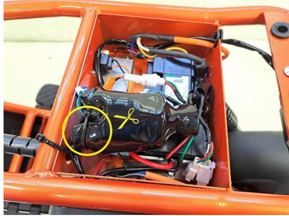
Katkaise johtojen suojaa kiinni pitävä nippuside (sivuleikkurit).