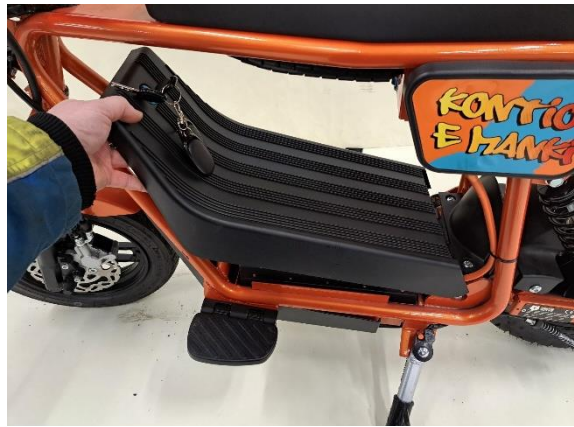
Ota akkukotelon kansi pois.