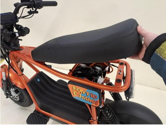
Ota istuin pois.